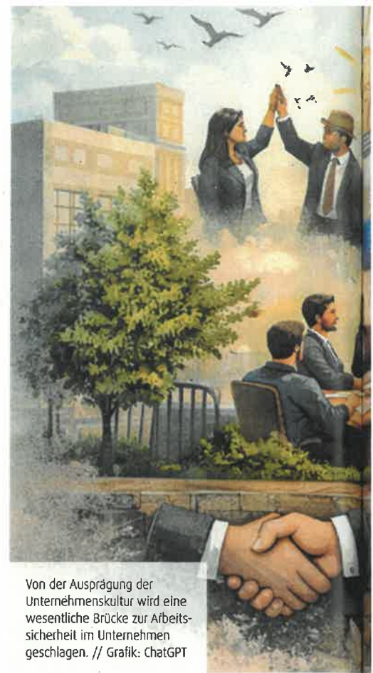
Von der Ausprägung der Unternehmenskultur wird eine wesentliche Brücke zur Arbeitssicherheit im Unternehmen geschlagen.

Weiter gilt der Satz: „Der machtvollste Weg, um auf Menschen Einfluss zu nehmen, ist, ein positives Vorbild zu sein.“ Das Verhalten von Autoritätspersonen wird meist als Leitschnur genommen und in vielen Fällen unbewusst auf das eigene Verhalten übertragen. Es ist also wichtig, wie die Führungskräfte ihre Vorbildfunktion im Unternehmen wahrnehmen. Leben sie, was sie sagen, oder predigen sie Wasser und trinken Wein? Als dritte Einflussgröße für das Verhalten der Mitarbeiter ist die Kultur des Unternehmens relevant. Ja, was ist