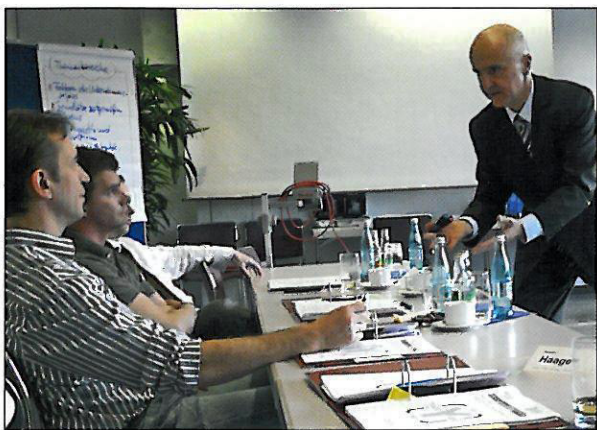
Die FEB-Teilnehmer werden herausgefordert

In insgesamt 15 Einheiten lernen die 15 Mitarbeiter bis Juni 2010 aus den verschiedenen Abteilungen von